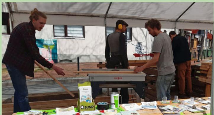
Die Architects4Future bei der Arbeit

Die Hildesheimer Wanderbaumallee wird organisiert von: